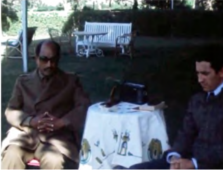
جانب من لقاء بين عبد السلام جلود والرئيس المصري محمد أنور السادات، بمدينة القنطرة بشأن محادثات وقف إطلاق النار، مصر، 1973.